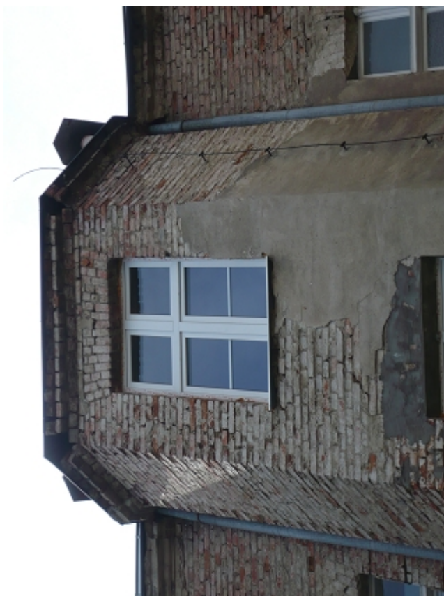
Ryzalit kl. schodowej pod okapem