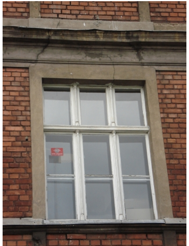
OKNO 1 PIĘTRA – el. północna