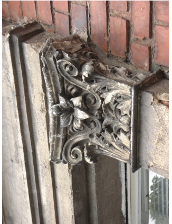
GŁOWICA GIPS.PILASTRÓW OKIEN 2 PIĘTRA