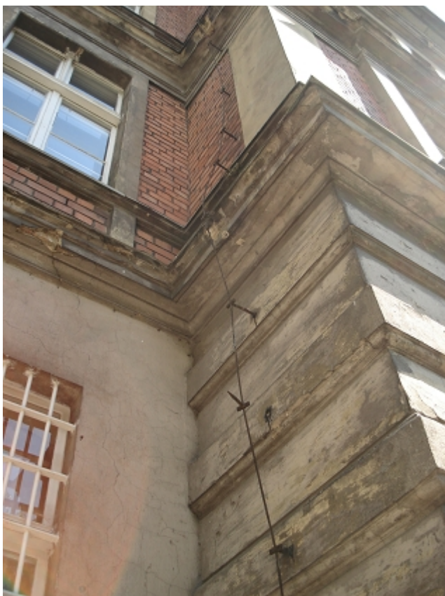
GZYMS PARTEU-zbrojenie, zmiana szerokości przy przejściu na skrzydło zachodnie