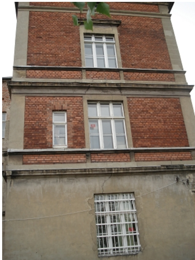
ELEWACJA PŁN.-ZACH. - skrzydło zachodnie