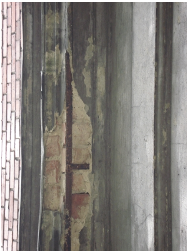
ZBROJENIE GZYMSU NAD PARTEREM