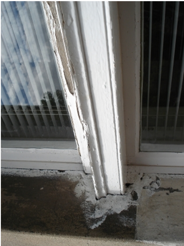
ŚLEMIEŃ OKNA SKRZYNKOWEGO