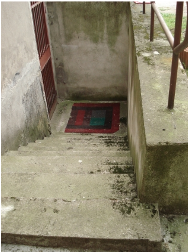
ZEJŚCIE DO PIWNICY – skrzydło zach.