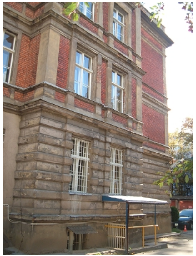
ELEWACJA P ŁN.- ZACH. - skrzydło zach.