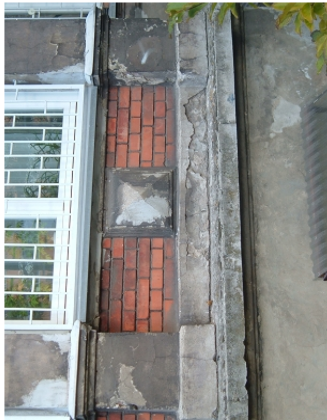
GZYMS COKOŁOWY, detal pod oknami werandy