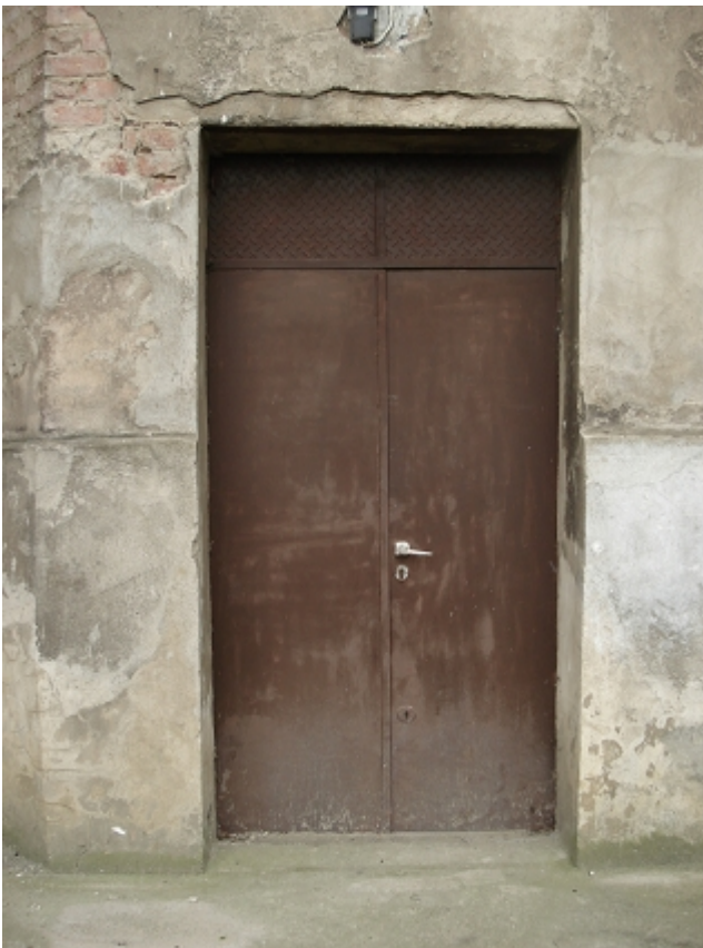
WEJŚCIE OD PODWÓRKA