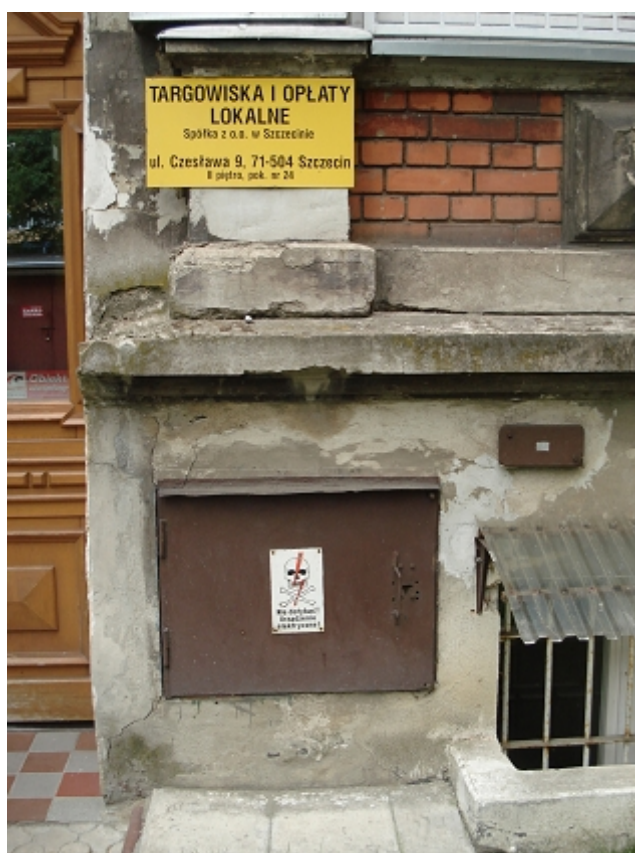
NAROŻNIK WEJŚCIA GŁÓWNEGO