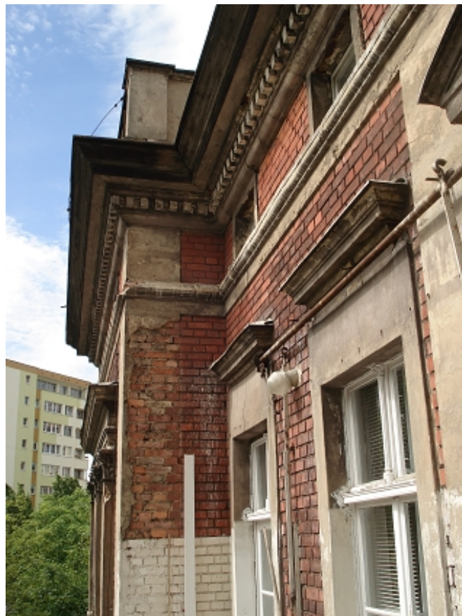
GZYMS okien tarasowych, gzyms parapetowy okien poddasza