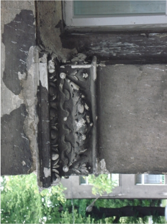
GŁOWICA GIPS.PILASTRÓW OKIEN PARTERU