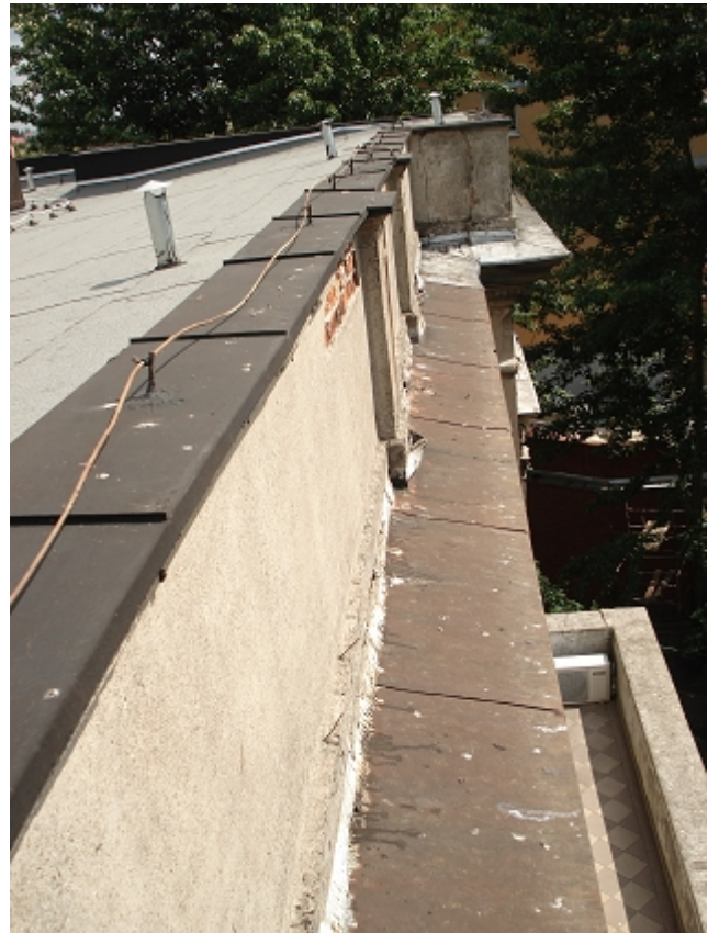
ATTYKA I GZYMS KORONUJACY