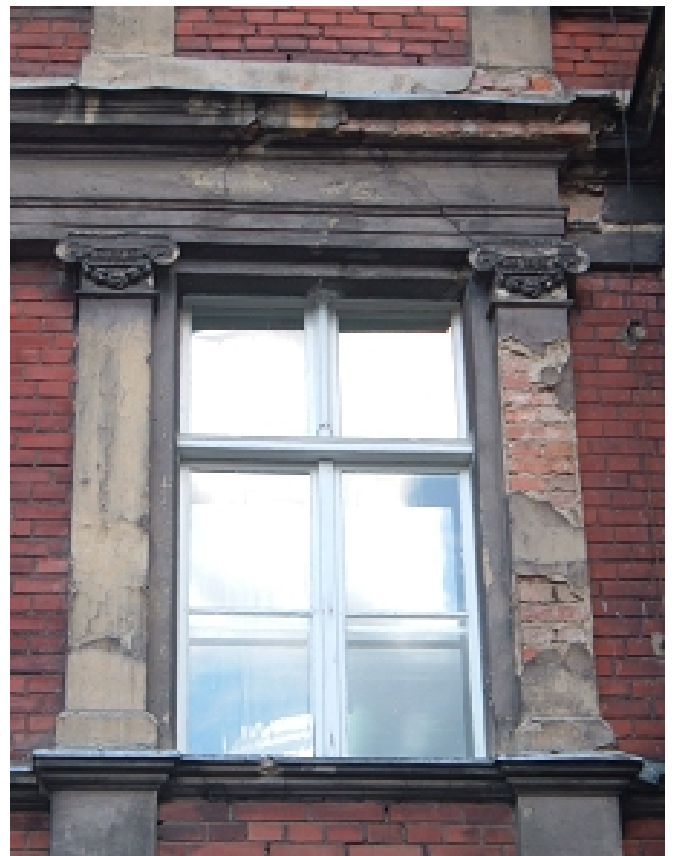
OKNO 1 PIĘTRA