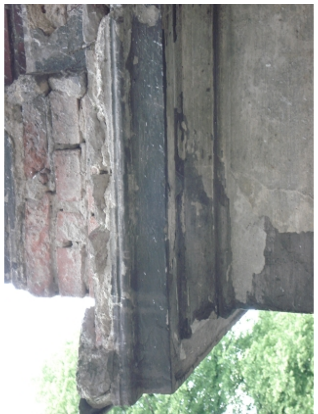
GZYMS PARTERU - weranda