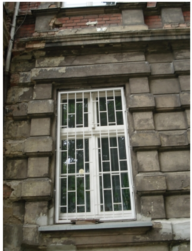
OKNO PARTERU - bonie