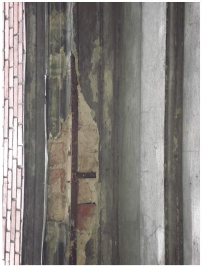
Zbrojenie gzymsu nad parterem