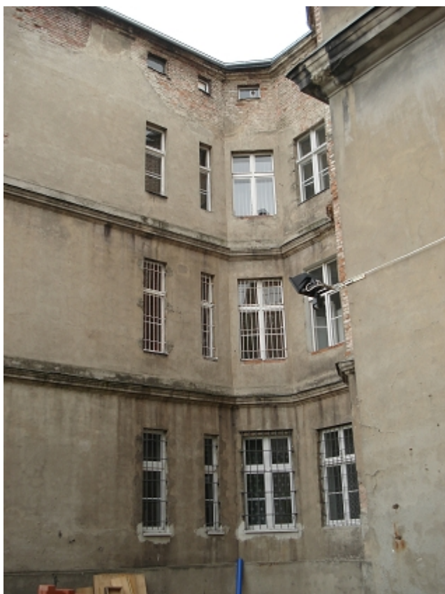
ELEWACJA PŁN. - skrzydło wschodnie