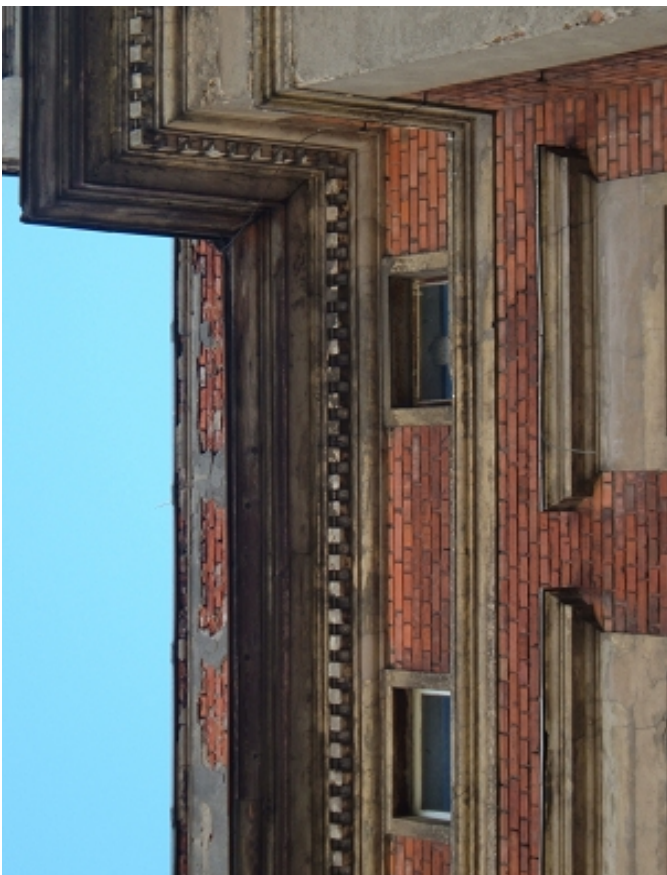
GZYMSY-koronujący i parapet. okien poddasza