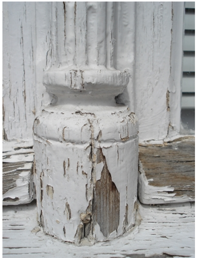
KOLUMIENKA NA SŁUPKU GÓRNYM – kapitel, baza