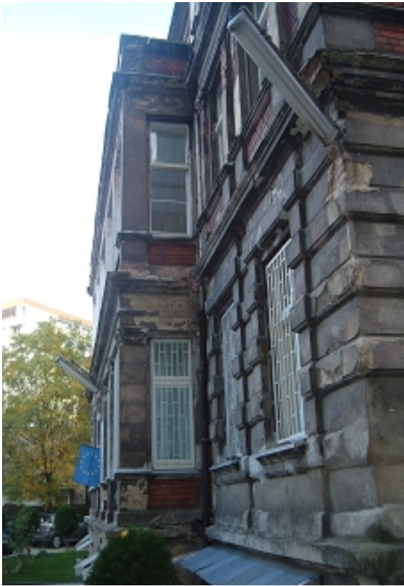
ELEWACJA PŁD-WSCH.-narożnik werandy