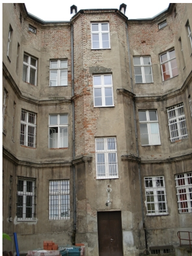
ELEWACJA PŁN. - klatka schodowa