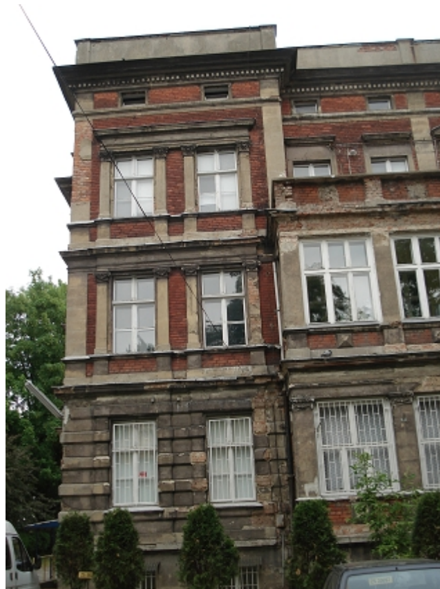
SKRAJNE DWIE OSIE ELEWACJI PŁD-WSCH.