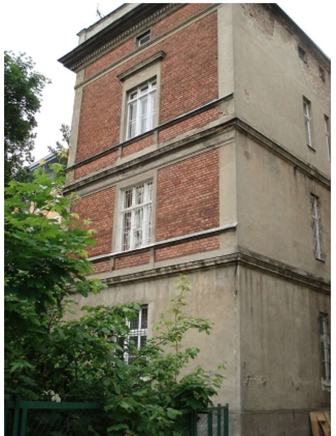
ELEWACJA Skrzydła wsch. od podwórka