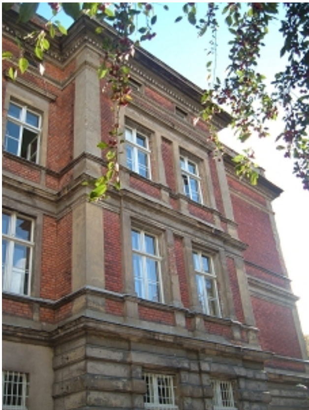
ELEWACJA PŁN.-skrzydło wschodnie