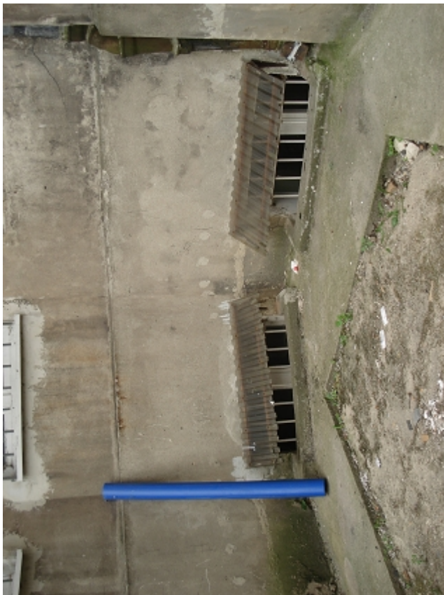
OPASKA BET. I OKNA PIWNICZNE -podwórka