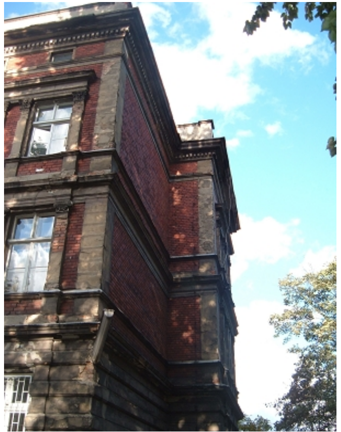
ELEWACJA PŁD-ZACH./ PŁD.-WSCH.-narożnik