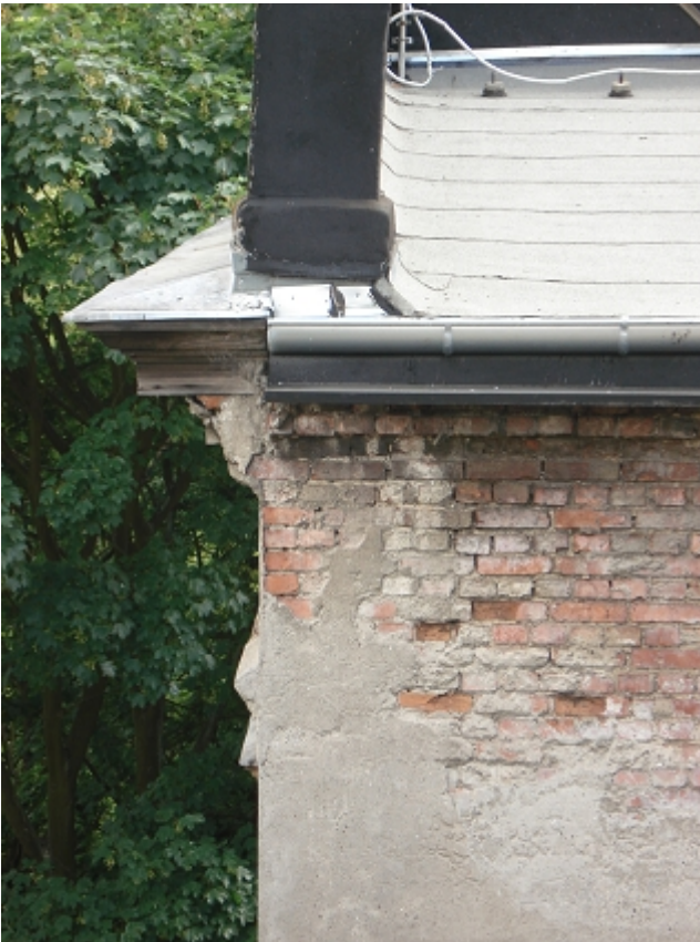
STYK GZYMSÓW- koronującego i od podwórka