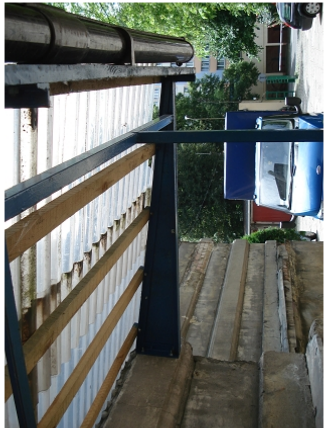
ZEJŚCIE DO PIWNICY – ryzalit zachodni, zadaszenia